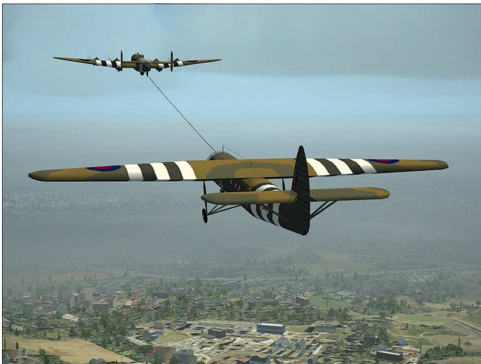
Horsa glider getrokken door Halifax bommenwerper.

De beheerder van de graven, de Common Wealth War Graves Commission, is destijds tewerk gegaan op gegevens die werden verstrekt door de gemeente St. Michielsgestel maar deze gemeente en ook de Commission wensen niet verder op deze kwestie in te gaan. Vandaar deze analyse: