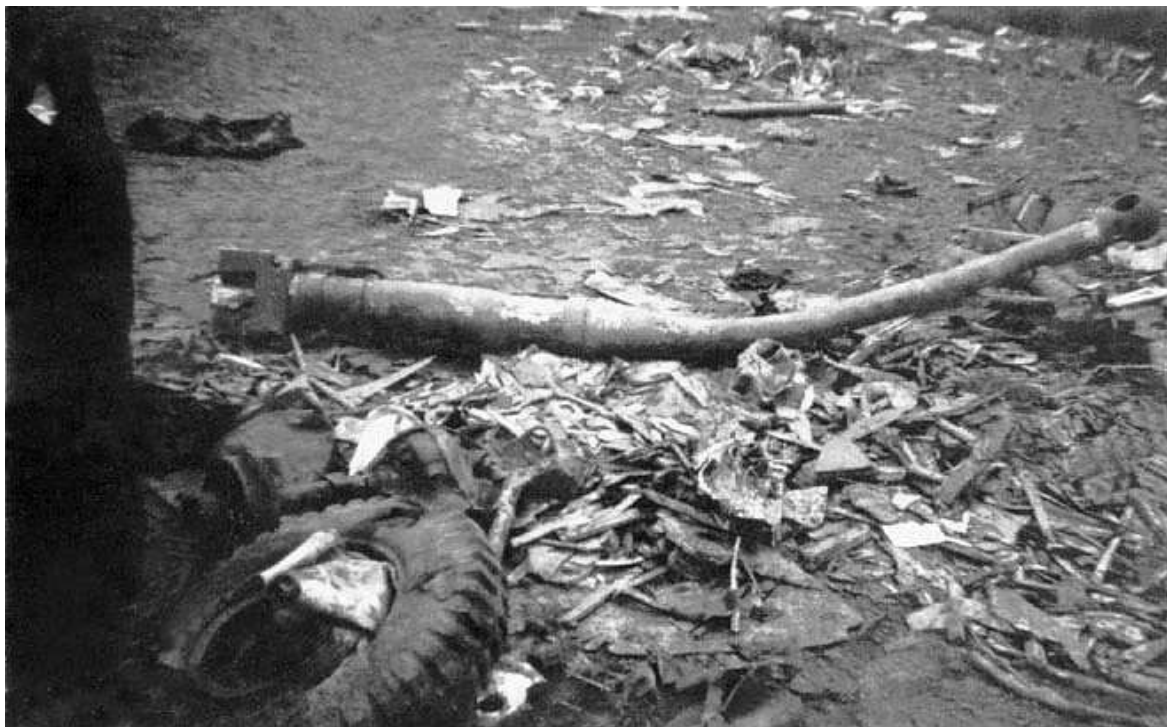
De loop van het 6 pponder anti-tank geschut uit glider 126.