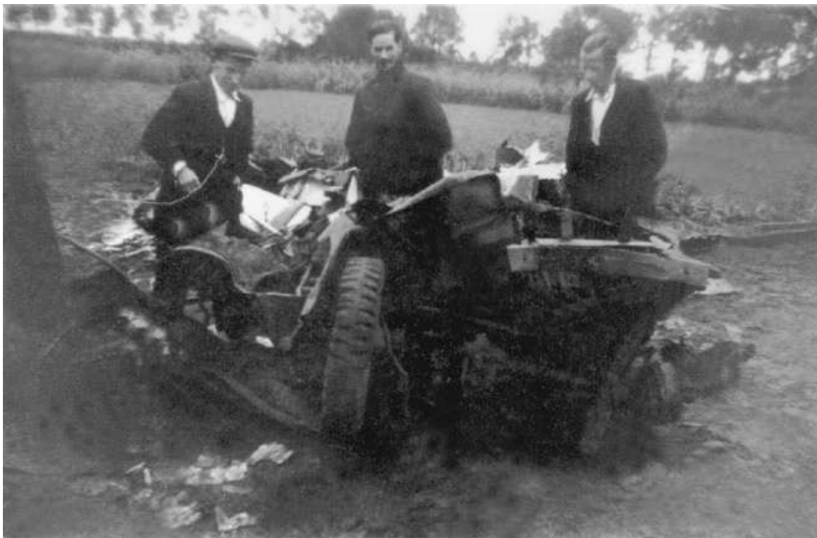
De resten van de jeep die met glider 126 werd vervoerd.

Een schot valt en in plaats van Sien wordt Anneke gedood. Zij is daarmee het tweede slachtoffer van oorlogsgeweld in St. Michielsgestel. De zoon van Sien werd in zijn arm geschoten. Op 21 september is Anneke begraven op de R.K. begraafplaats aan de Nieuwstraat".